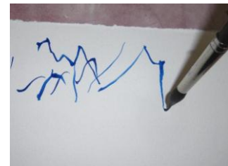
Le pinceau jupon possède toutes les qualités d'un traceur + une réserve d'eau importante

Les bons pinceaux coûtent cher, mais vous pourrez les conserver très longtemps si vous en prenez soin. Ne jamais les laisser tête dans l'eau, les rincer soigneusement après usage et les faire sécher à la verticale, puis les ranger dans un tapis en bambou qui évite la moisissure et de les déformer lorsque vous les transportez.