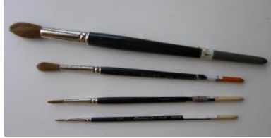
En martre Kolinski (très chers), irremplaçables, précis, nerveux