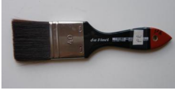
Un spalter pour mouiller le papier